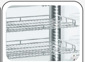
Griglie cromate regolabili