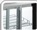
Porte scorrevoli posteriori